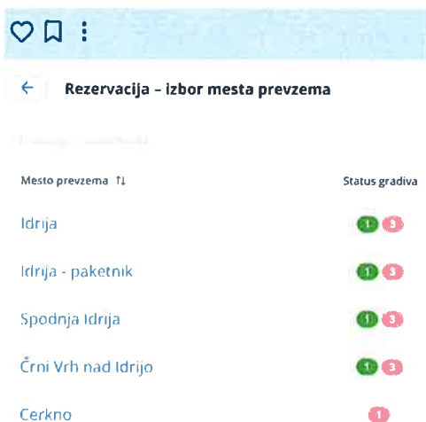
Slika 6: Izbira prevzemnega mesta COBISS Plus na spletu.

V letu 2025 smo za uporabnike pripravili storitev prevzemnih mest, kar pomeni, da si lahko člani sami preko sistema COBISS izberejo, na kateri lokaciji bodo prevzeli gradivo. Izbirajo lahko med knjižnicami, ki so medoddelčno povezane – Idrija, Črni Vrh, Spodnja Idrija.