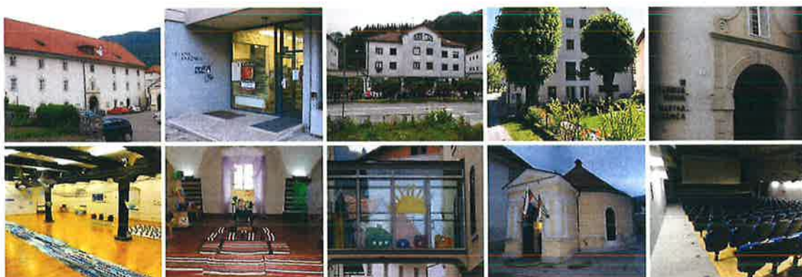
Slika 1: Mestna knjižnica in čitalnica Idrija in njene enote ter prostori.

MKČI je splošna knjižnica , ki s štirimi enotami (Mestna knjižnica in čitalnica Idrija, Knjižnica Spodnja Idrija, Bevkova knjižnica Cerkno in Knjižnica Črni Vrh) ter notranjo organizacijsko enoto Filmsko gledališče Idrija deluje na območju Občine Idrija in Občine Cerkno. To območje obsega skupaj 425,3 m 2 (od tega občina Idrija 293,7 m 2 , občina Cerkno pa 131,6 m 2 ) in na dan 31. 12. 2024 šteje skupaj 16.085 prebivalcev (od tega občina Idrija 11.427 prebivalcev, občina Cerkno pa 4.658 prebivalcev).