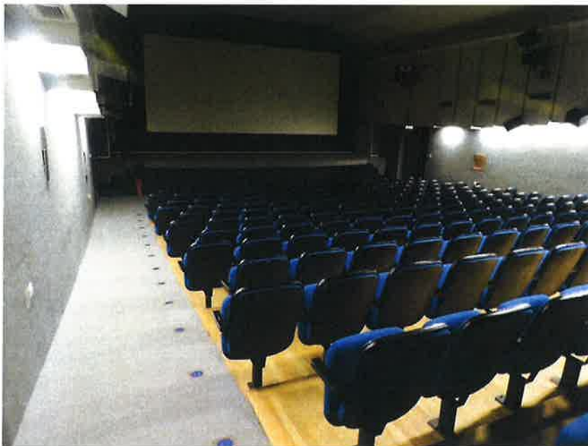
Slika 9: Filmsko gledališče Idrija