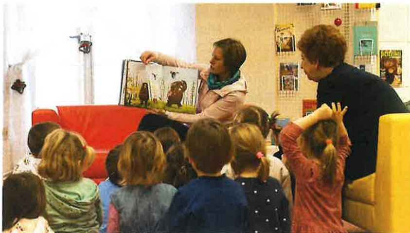
Slika 5: Obisk vrtca.