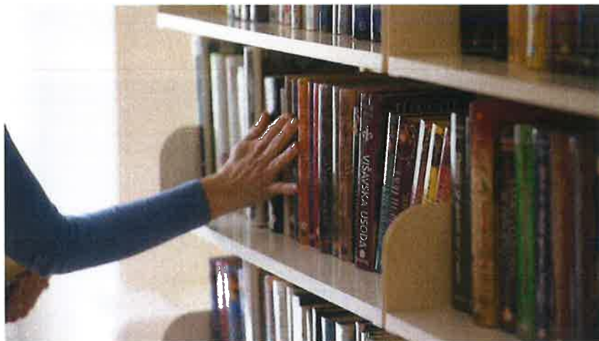
Slika 8: Skrb za urejenost knjižnih polic in gradiva samega.

Mestna knjižnica in čitalnica Idrija deluje v stavbi Rudniškega magazina, ki je razglašena za spomenik državnega pomena in vpisana na seznam svetovne dediščine pri UNESCO. V planu je vgradnja dvigala, ki bo omogočala dostop do knjižnice in galerije tudi gibalno oviranim. Pri tem bo potrebna določena preureditev knjižnice. Posledica bo tudi zmanjšanje števila polic za knjižnično gradivo. Ker se že tako soočamo s pomanjkanjem prostora, je rešitev v dodatni pisarni, saj imamo trenutno eno delovno mesto poleg čitalnice.