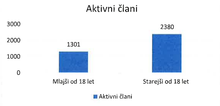
Slika 4: Delež aktivnih članov v letu 2025.

**V maju 2024 smo uvedli članarino, posledica tega je zmanjšanje aktivnih članov v letu 2025.