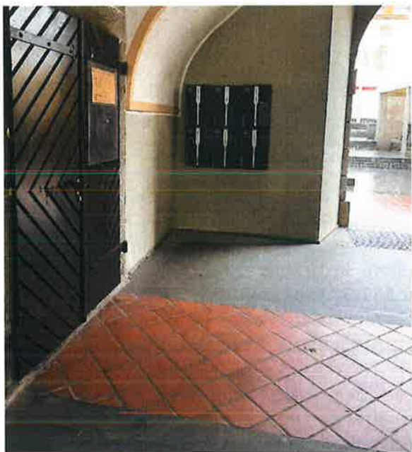
Slika 7: Paketnik

Nova možnost prevzema je tudi paketnik, ki je nameščen v podhodu Magazina. S postavitvijo paketnika smo uporabnikom omogočili prevzem in vračilo gradiva tudi izven odpiralnega časa in v obdobjih zmanjšane odprtosti knjižnice – med poletnim urnikom in v času praznikov.